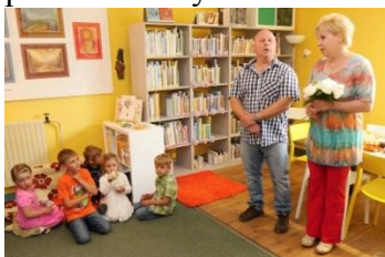
Slavnostní otevření za účasti vedení obce a veřejnosti.

Obora – rozšíření knihovny za finanční účasti obce – stavební úpravy, vymalování, podlahová krytina.