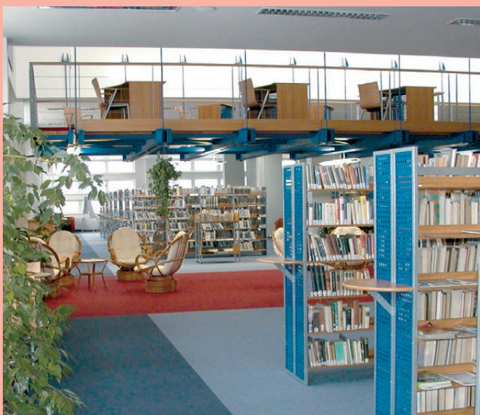
KK Karlovy Vary

(Směrnice IFLA: Služby veřejných knihoven, článek 12)