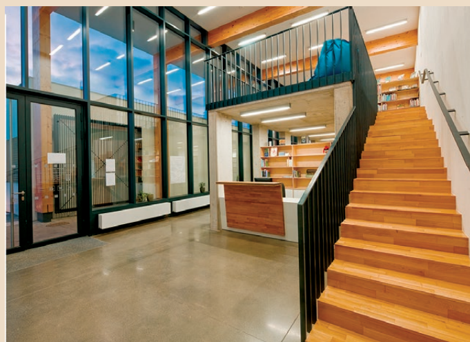
ObK Bílovice nad Svitavou