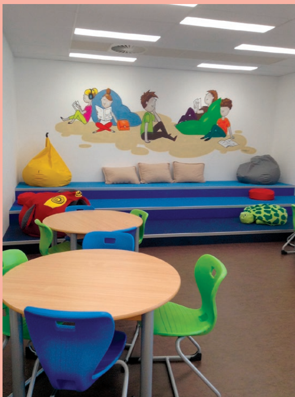
MěK Valašské Meziříčí