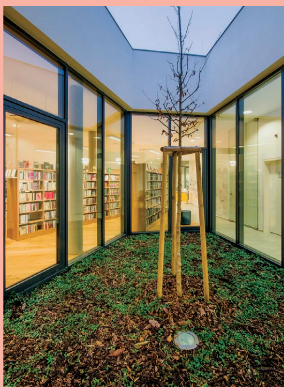
MK Ostrožská Nová Ves

Knihovna nabízí studijní místa 13 pro dospělé, děti a mládež, kde mohou uživatelé pracovat s knihovními dokumenty a informačními zdroji, a to individuálně nebo ve skupině. Tam, kde to místní podmínky umožní, je vhodné vytvářet čítárny, individuální a týmové studovny a místa pro soustředěné studium.